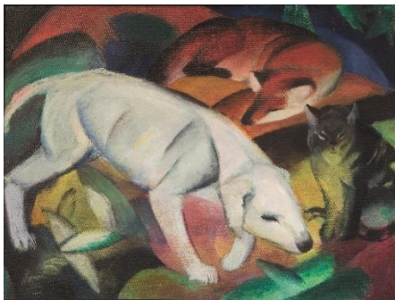
Franz Marc, Trois animaux (chien, renard et chat), 1912, Huile et tempera sur toile, Kunsthalle Mannheim